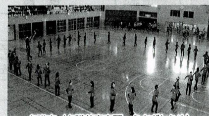
名護市 (名護美童音頭・うさぎとかめ)