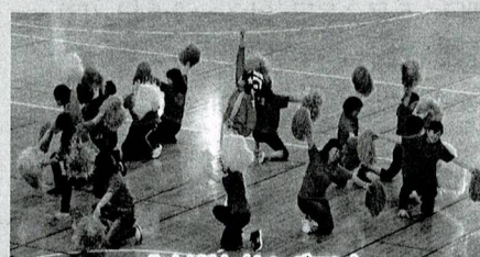
北中城村 (ヤングマン)