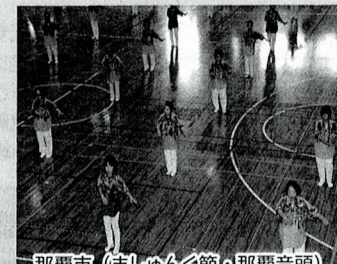
那覇市 (ましゅんぐ節・那覇音頭)