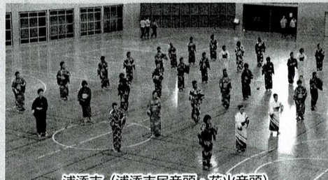
浦添市 (浦添市民音頭・花火音頭)