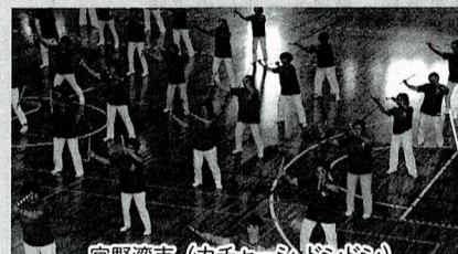
宜野湾市 (カチャーシドンドン)