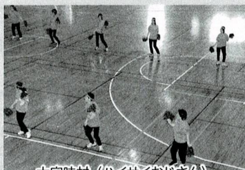
大宜味村 (ハイサイおじさん)