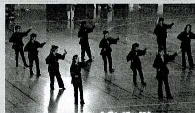
うるま市 (ずんどご節)