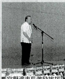
宜野湾市長激励挨拶