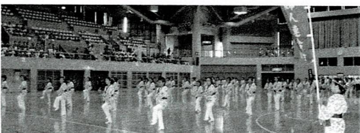
浦添市：浦添市民音頭 まつりだまつりだティルンテン