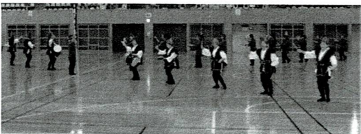
沖縄市：かりゆしどー沖縄市