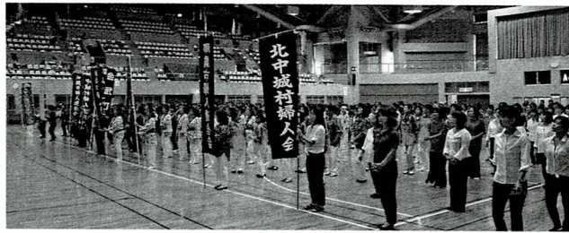
市町村はのぼり旗を先頭に入場

日時：平成 29 年 7 月 9 日 (日) 場所：宜野湾市立体育館 主催 (一社) 沖縄県婦人連合会 共催 宜野湾市婦人連合会