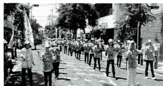
平成 28 年宮古まつりひき踊り参加

人との出会いで美しく明るいご婦人を目指して花筏のように 「一人の百歩より百人の一步ずつで」歩んでいけたらと思います。 いよいよ、婦人の演芸会第 52 回平成 30 年 6 月 2 日に開催さ れます。宮古島へどうぞ!