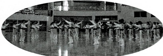
おきなわ結舞踊：沖縄に恋したら