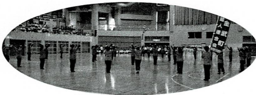
金武町：金武村歌・ふるさとちばりよう