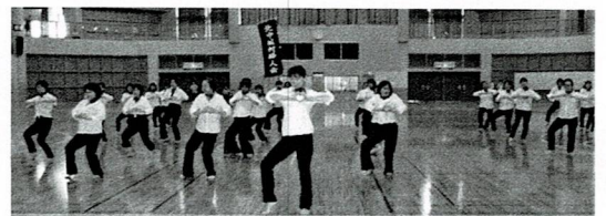
北中城村：「どうにもとまらない」