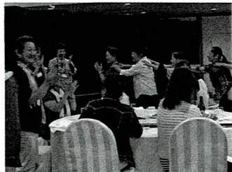
懇親会では舞台につられて全員踊り出す

平成 29 年度沖縄連中央研修は、価値観や生き方の多様性を背景に今日的会活動の課題について、組織が抱える課題を学習し合い、共有する事で、活性会に繋ぎ、明るく楽しい婦人会活動を目指す研修会として開催した。 各市町村婦人会役員・会員百三十名は、宿泊で交流を深め、情報交換など多くの婦人会パワーを楽しんだ。