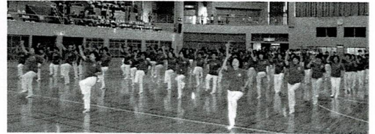
宜野湾市：宜野湾音頭 美らがんじゅう体操