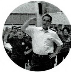
佐喜眞宜野湾市長 準備運動にも参加

冷房施設が整い快適な環境の宜野湾市民体育館で、出演市町村がのぼり旗を先頭に賑やかに入場、10 団体 500 名余の参加で開催した。