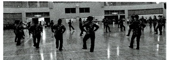
名護市：くるくる口説き・あきさみよー