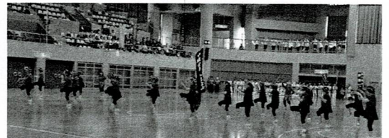
中城村：中城小唄・ちょーんちょーん節