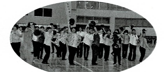
大宜味村：シークワサー音頭