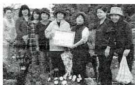
第 1 回花園コンクール 平成 16 年 2 月・狩俣学区入賞